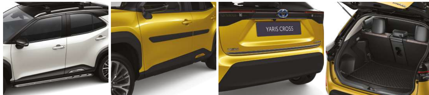
Бокові підніжки Молдинги дверей Хромована накладка дверей багажного відділення Горизонтальна сітка кріплення вантажу