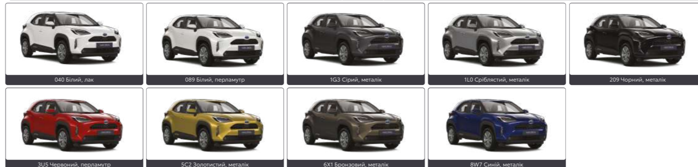
040 Білий, лак 089 Білий, перламутр 1G3 Сірий, металік 1LD Срібlistий, металік 209 Чорний, металік 3U5 Червоний, перламутр 5C2 Золотистий, металік 6X1 Бронзовий, металік 8W7 Синій, металік