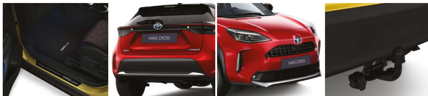
Алюмінієві накладки порогів, комплект передніх Декоративна накладка заднього бампера Декоративна накладка переднього бампера Фаркол з емнім, горизонтальний