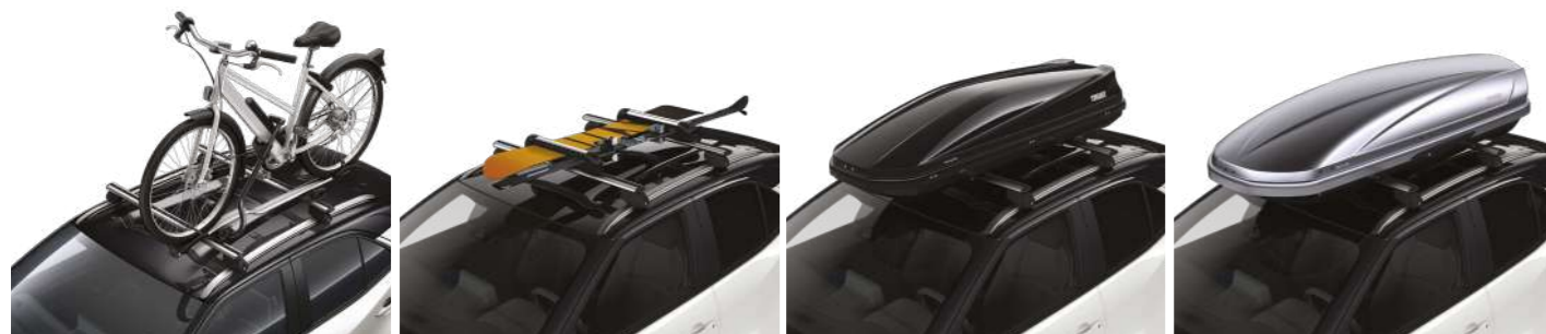
Кріплення велосипеда на дах Кріплення для лиж та сноуборду Багажний бокс, чорний Багажний бокс, срібний