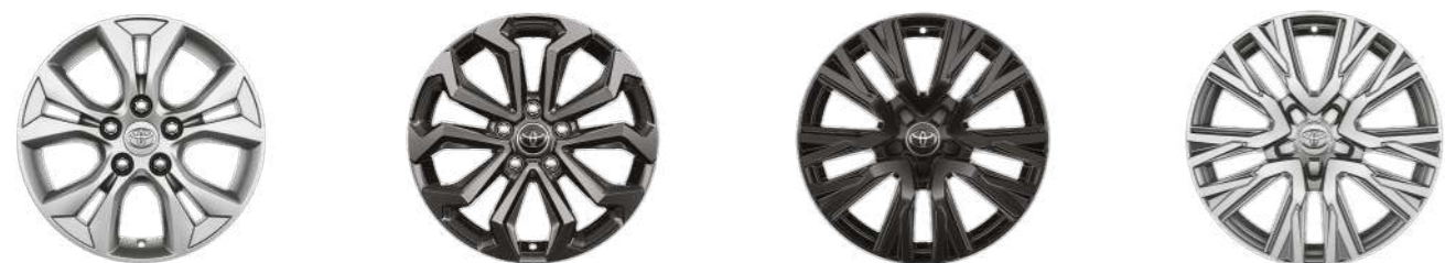
Легкосплавні диски 17" Легкосплавні диски 17" Легкосплавні диски 17" Легкосплавні диски 17"